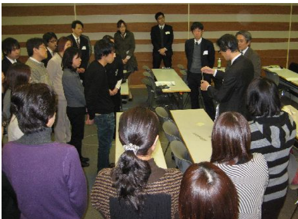
演者による使用法の説明